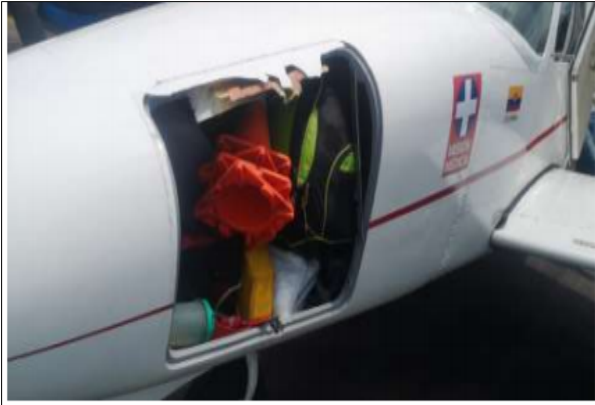
Fotografía No.1: desprendimiento de la compuerta de la bodega