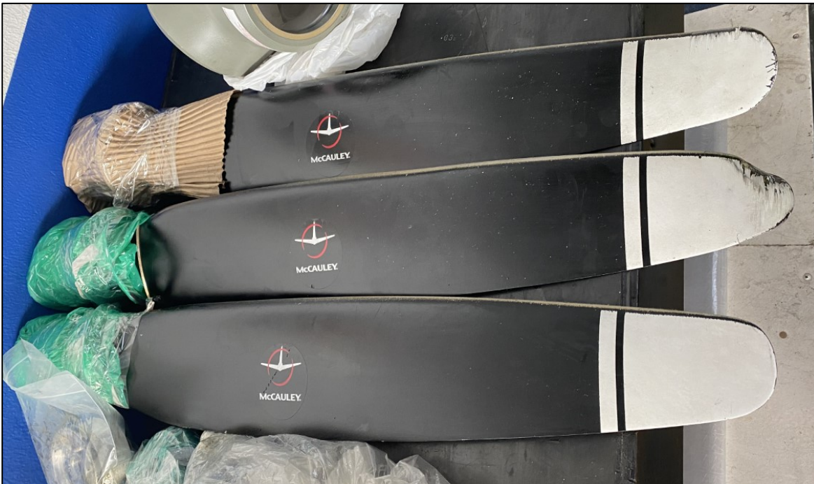
Fotografía No. 2: daños en las palas de la hélice del motor izquierdo del HK 2946