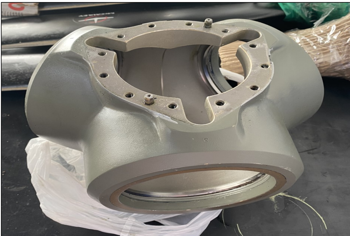
Fotografía No. 3: Inspección posibles daños en el HUB de la hélice del motor N.1